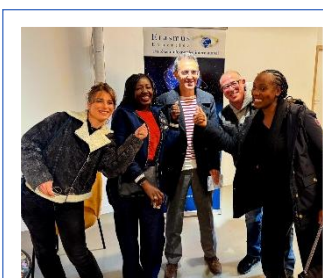
Fin du colloque

La journée s'est terminée par un verre de l'amitié partagé avec tous les participants du colloque