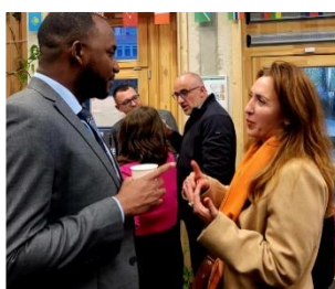
Verre de l'amitié